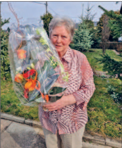
80. Geburtstag Frau Drechsler