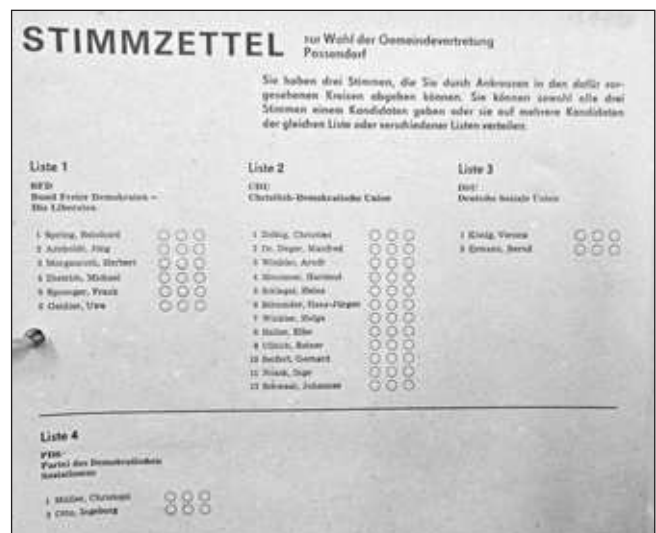
Stimmzettel zur Volkskammerwahl am 18. März 1990.