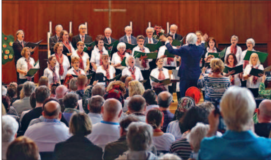
Der Gesangverein Possendorf wird auch beim Chorkonzert in der Lukaskirche Dresden am 13. April dabei sein.

Singen macht gesund und glücklich. „Oh, Happy Day“ ist dafür ein Beispiel. „Oh, Happy Day“ ist aber nicht nur ein weltweit bekannter Gospel, sondern auch das Motto des großen Chor-Projektes, das vom 11. bis 13. April in Bannewitz stattfinden wird. Rund 120 Sängerinnen und Sänger aus mehreren Generationen werden drei Tage proben und dann am Sonntag, dem 13. April in der Lukaskirche Dresden in einem großen Chorkonzert gemeinsam singen.