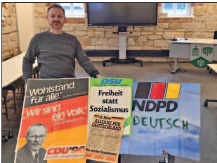
Werbeplakate vom März 1990, von Einwohnern dem Chronik-Archiv übergeben.